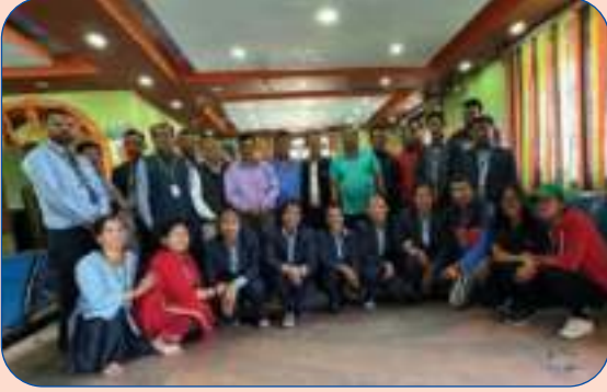
संस्थाको व्यवस्थापन परिवार