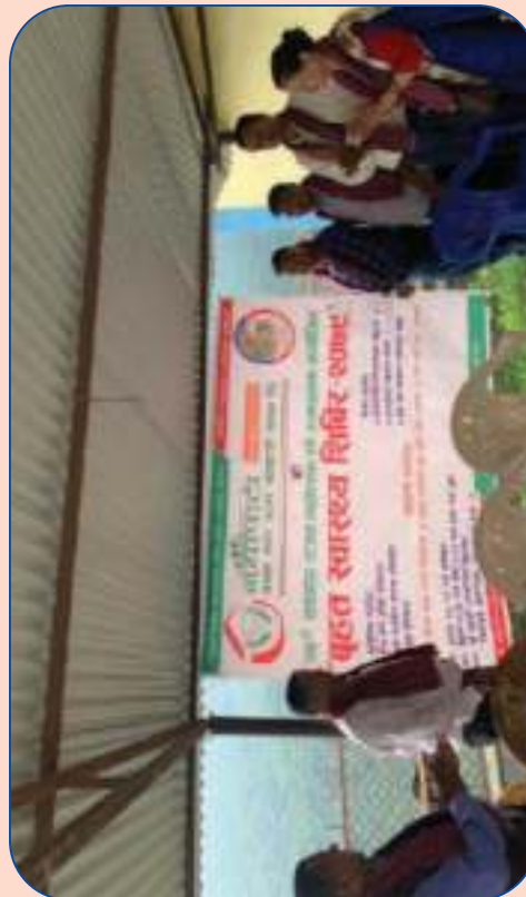
संस्थाबाट स्वास्थ्य शिविर सञ्चालन