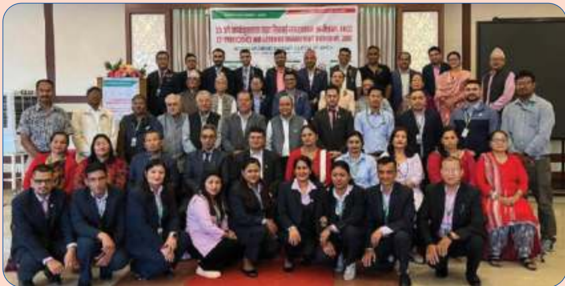
३३ औं कार्यकुशलता तथा सिकाई व्यवस्थापन कार्यशालामा सहभागी ACCESS BRANDING कार्यक्रममा सहभागी संस्था/पदाधिकारीहरू