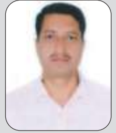
चिरञ्जिवी सिंखडा सचिव

नयाँपाटी बचत तथा ऋण सहकारी संस्था लि.को २६ औं वार्षिक साधारण सभाका सभाध्यक्ष ज्यू प्रमुख अतिथिज्यू विशेष तथा अन्य अतिथिज्यूहरु, अन्य सहकारी संघ/संस्था बाट आउनु भएका अध्यक्ष तथा प्रतिनिधिका रूपमा आतिथ्यता ग्रहण गरी रहनु भएका व्यक्तित्वहरु, संस्थाको संस्थापक ज्यूहरु, सञ्चारकर्मी मित्रहरु, सञ्चालक मित्रहरु, लेखा सुपरिवेक्षण समितीका पदाधिकारीज्यूहरु, संस्थामा आबद्ध रहनु भएका विभिन्न उपसमितिका मित्रहरु, लघुवित्तका महिला दिदी बहिनीहरु, बाल बचत कर्ताहरु, संस्थाका संस्थापक अध्यक्ष एवं प्रबन्धक तथा कर्मचारी मित्रहरु एवं उपस्थित शेयर धनी महानुभावहरुमा हार्दिक स्वागत तथा सहकारी अभिवादन व्यक्त गर्दछु ।