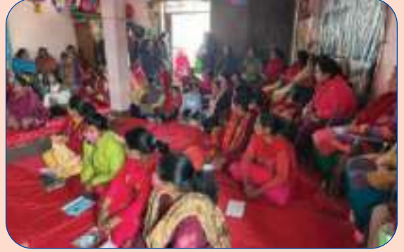
सदस्य विस्तारित मञ्च तथा शिक्षा कार्यक्रममा सहभागी जनाउँदै सदस्यहरु