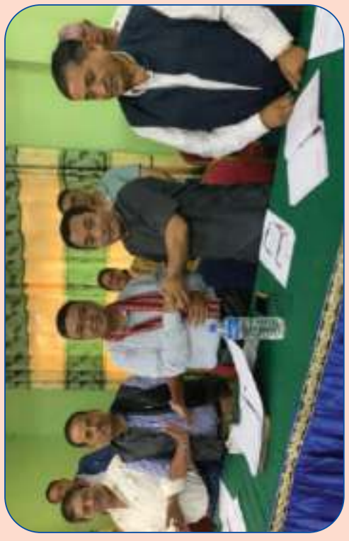
संस्थालाई कास्कून्द्वारा काठमाडौं जिल्लाको उत्कृष्ट सहकारी सम्मान