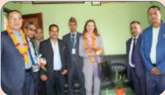
अतिथिज्यूहरु अध्यक्षज्यूको कार्यकक्षमा