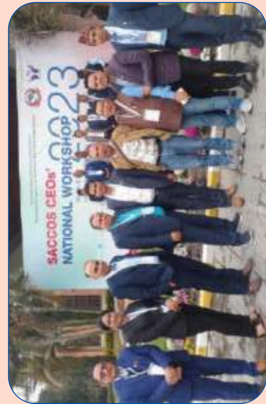
साकोसका व्यवस्थापकहरुको राष्ट्रिय गोष्ठीमा सहभागिता