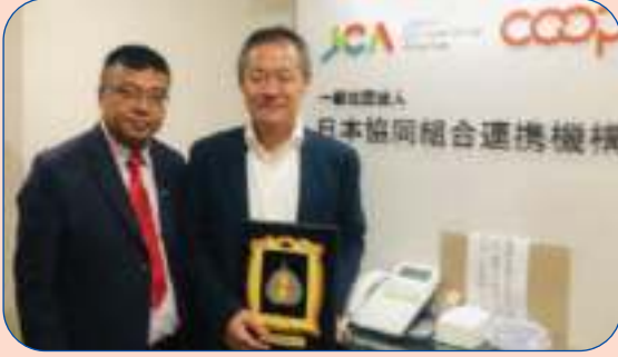
राष्ट्रिय सहकारी महासंघ मार्फत जापानको टोकियोमा सहभागी