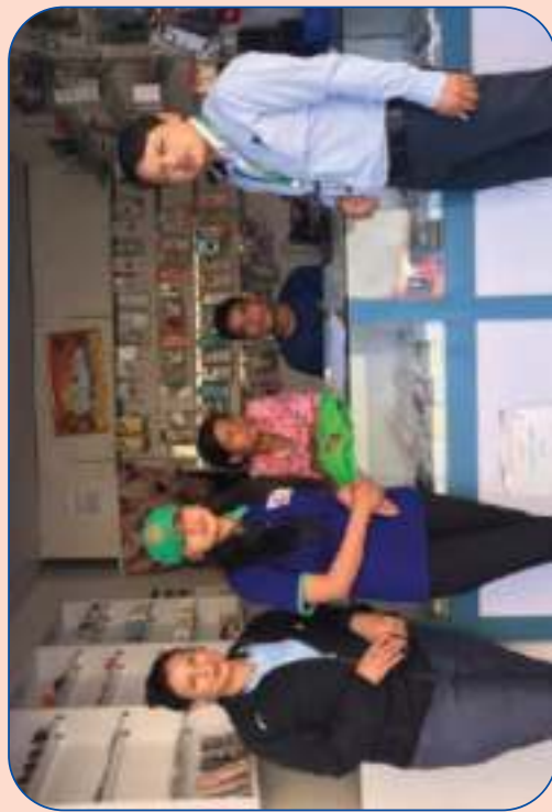
ल्यवस्थापन पक्षबाट ञ्छणको सदुपयोगिता जाँच गर्न घर दैलो कार्यक्रममा सहभागी