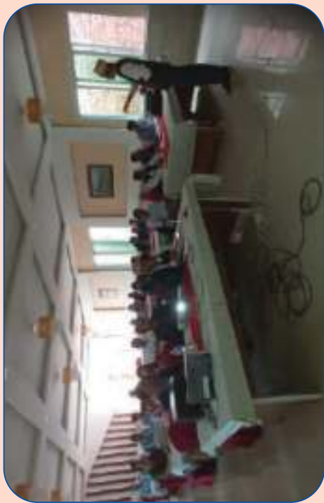
विभागका पदाधिकारीज्यूबाट सञ्चालक समितिलाई १ दिने प्रशिक्षण कार्यक्रम