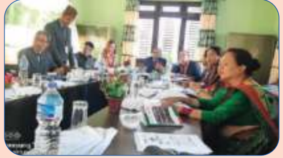
अतिथिज्यू हरुलाई संस्थाको बारेमा संक्षिप्त जानकारी गराउनु हुँदै