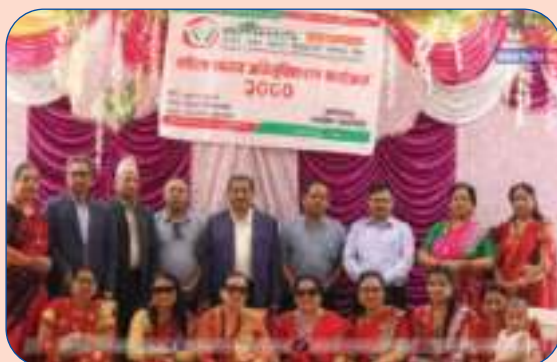
लघुवित्त उपसमितिद्वारा महिला सदस्य अभिमुखिकरण कार्यक्रम सञ्चालन