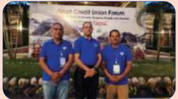
ACCU को अन्तर्राष्ट्रिय सम्मेलनमा (14 to 16 Sept), सहभागी. Hotel Soltee, Kathmandu