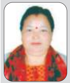
लक्ष्मी चालिसे सञ्चालक एवं संयोजक महिला उप-समिति