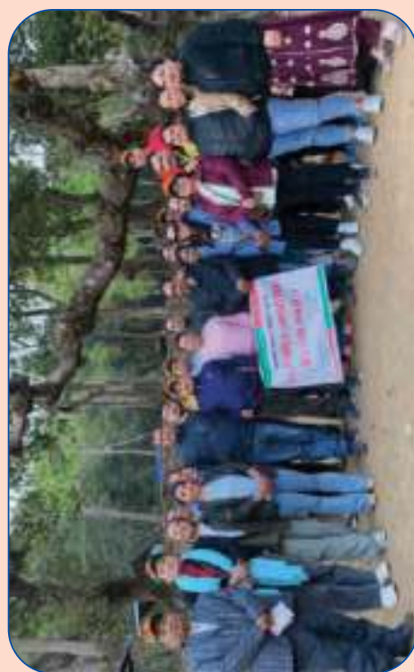
६६ औं राष्ट्रिय सहकारी न्यालीमा सहभागी हुँदै संस्थाका व्यवस्थापन परिवार