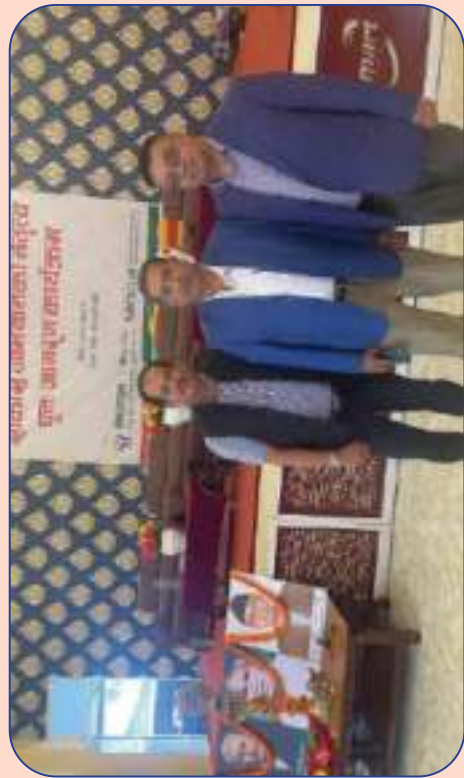
पुनः जागरण कार्यक्रममा सहभागी