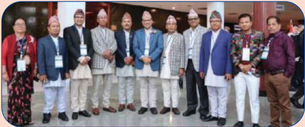
थाइल्याण्डमा आयोजित ACCU Fourm को अन्तर्राष्ट्रिय सम्मेलनमा सहभागिता