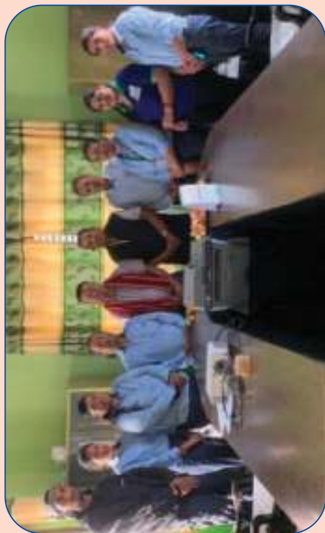
गोकर्णेश्वर न.पा.को सहकारी संयोजक मनोनयन हुनु भएकोमा संस्थाका उपाध्यक्षलाई बधाई ज्ञापन गर्दै