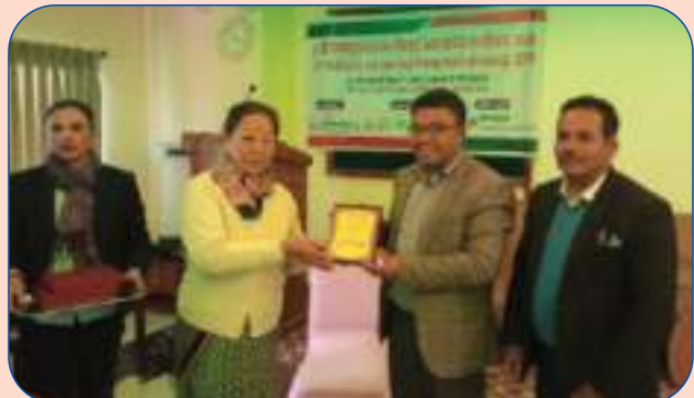
घादिङमा आयोजित 31 th ACCESS BRANDING 3 rd Batch मा सहभागी हुँदा मायाको चिनो ग्रहण गर्दै ।