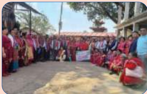
ज्येष्ठ नागरिकलाई तिर्थाटन (पलाञ्चोक भगवती)मा सहभागी