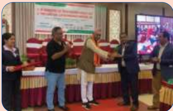
मायाको चिनो ग्रहण गर्दै अध्यक्षज्यू